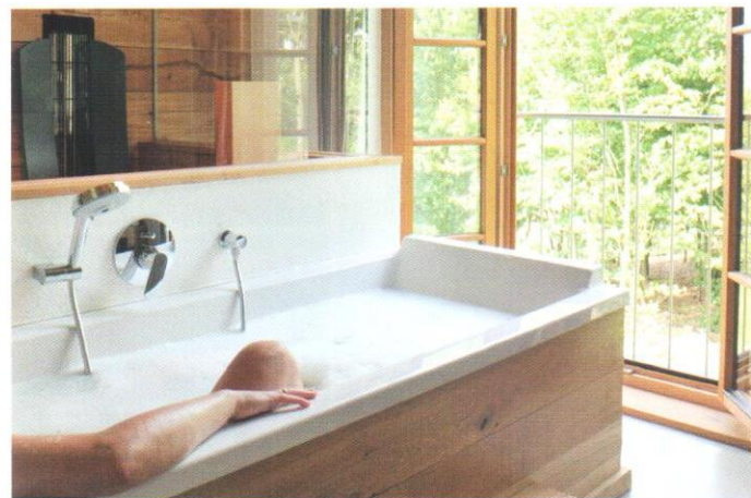
Beim Bad kann der Gast den Blick in die Ferne schweifen lassen