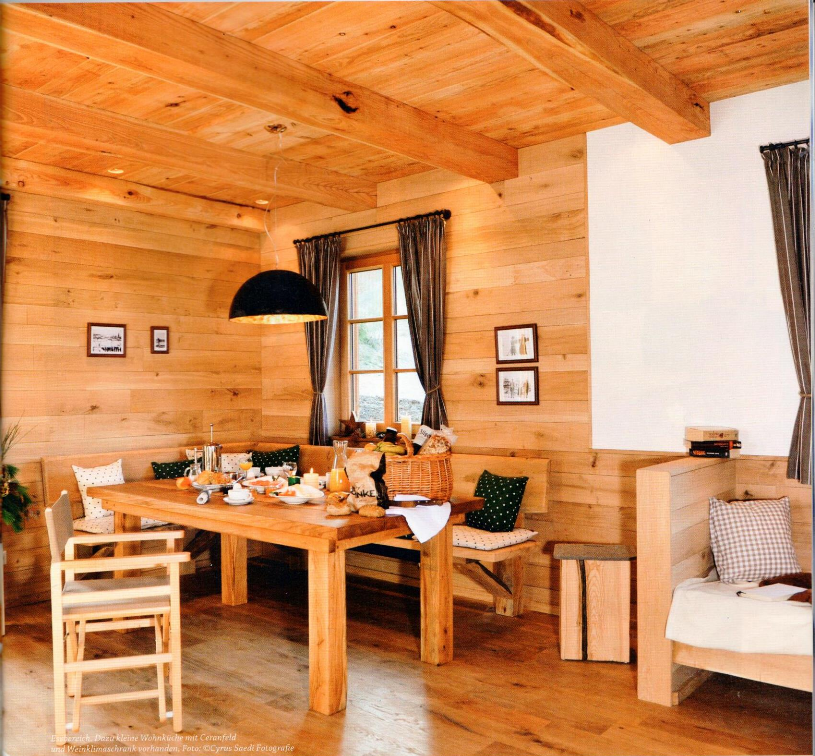
Essbereich. Dazu kleine Wohnküche mit Ceranfeld und Weinklimaschrank vorhanden.

die Schlafzimmer sind mit wohliger warmer Bettwäsche ausgestattet, und die Bademäntel gibt es gegen einen Aufpreis dazu.