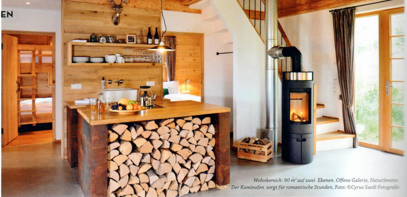
Wohnbereich: 90 m 2 auf zwei Ebenen. Offene Galerie, Naturfenster. Der Kaminofen sorgt für romantische Stunden