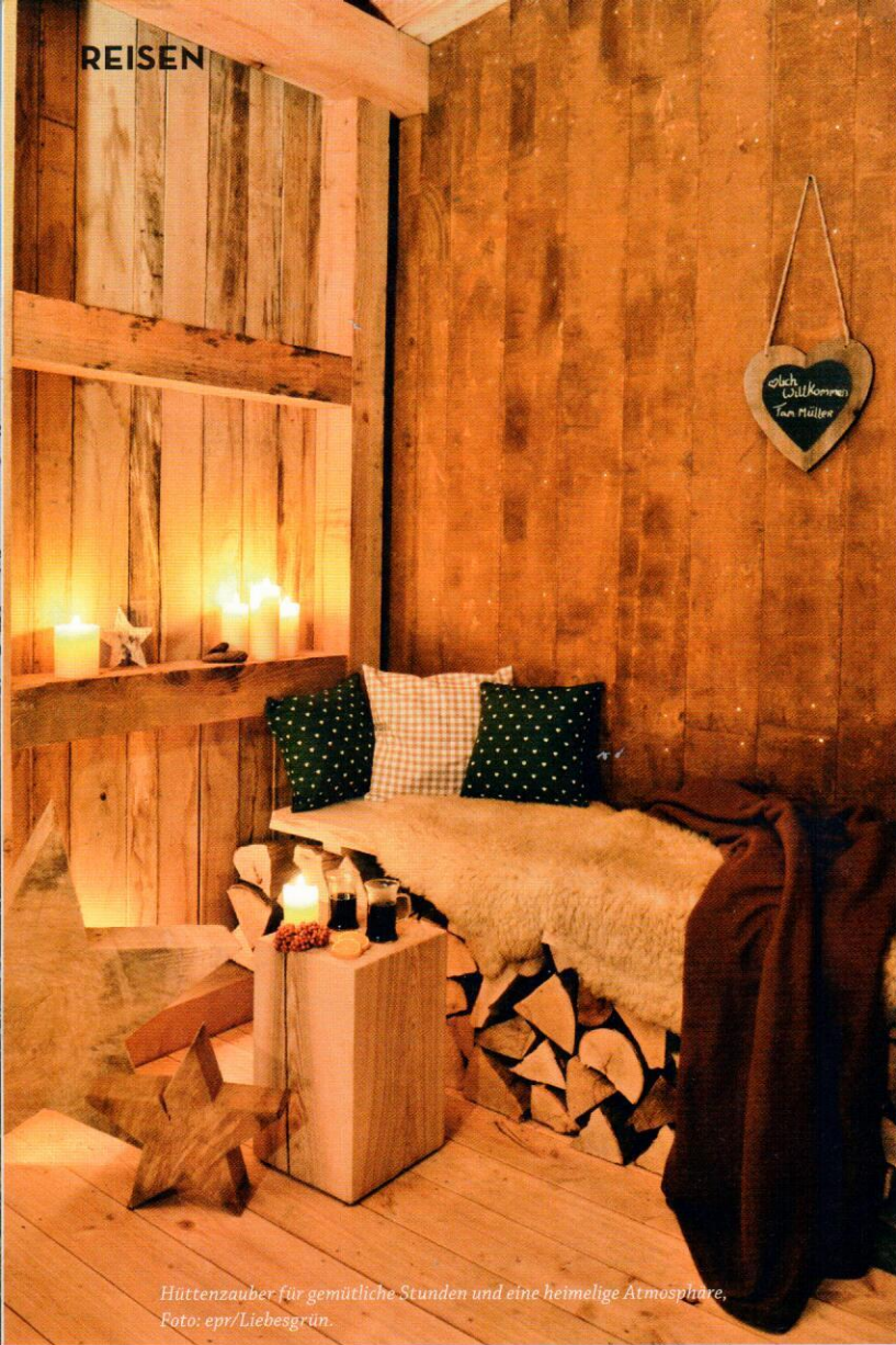
Hüttenzauber für gemütliche Stunden und eine heimelige Atmosphäre.