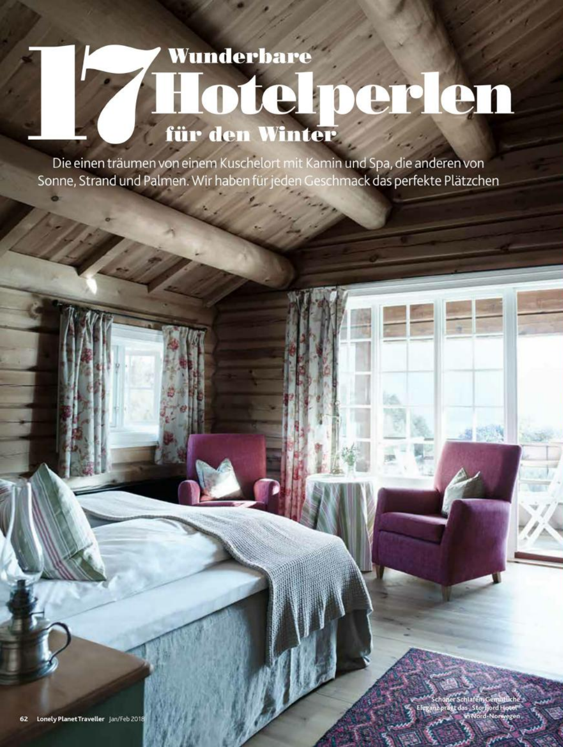
Schöner Schlafen, Gemütliche Eleganz prägt das „Storjord Hotel“ in Nord-Norwegen

Die einen träumen von einem Kuschelort mit Kamin und Spa, die anderen von Sonne, Strand und Palmen. Wir haben für jeden Geschmack das perfekte Plätzchen